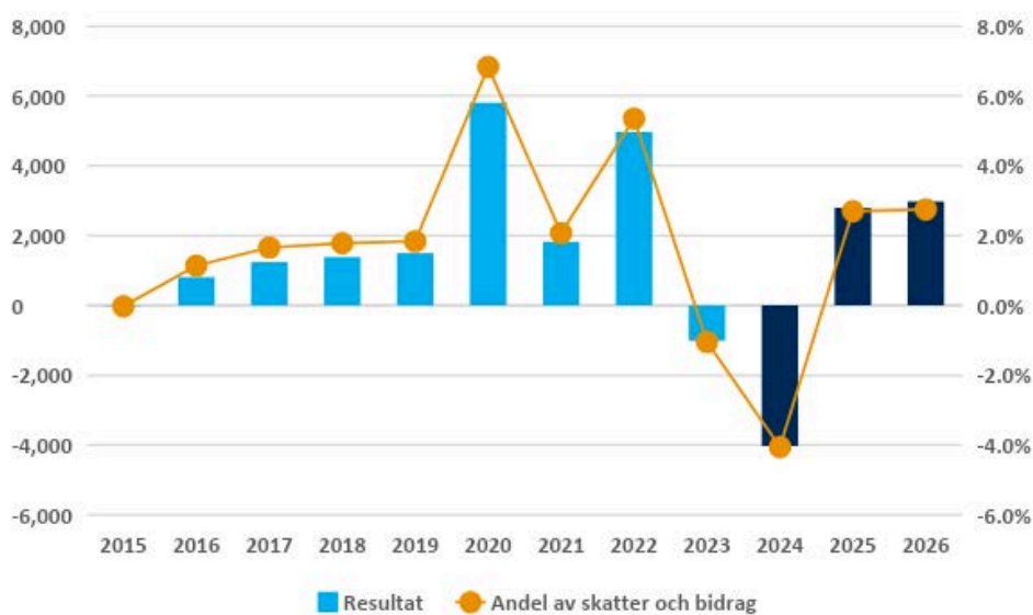
Figur 3. Region Stockholms resultat och resultatets andel av skatter och bidrag, angivet i miljoner kronor samt procent

Efter två år med underskott krävs överskott år 2025 för att öka den långsiktiga betalningsförmågan, soliditeten, och för att nå en ekonomi i balans i linje med Region Stockholms Policy för god ekonomisk hushållning (RS 2021-0285).